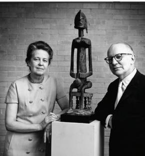
Dominique y John de Menil, 1967

La Colección Menil comenzó con los filántropos franceses John y Dominique de Menil. Al llegar a Houston, durante la Segunda Guerra Mundial, la pareja se convirtió rápidamente en figura clave del desarrollo de la vida cultural de la ciudad. Ellos empezaron a coleccionar arte intensamente en la década de 1940, acumulando tenencias importantes de pinturas, esculturas, impresos, dibujos, fotografías y libros extraordinarios. Antes de la muerte de John de Menil, en 1973, la pareja había hablado sobre la construcción de un museo. Dominique de Menil, quien vivió 25 años más que su esposo, se dedicó a este objetivo. Desde que la Colección Menil abrió, en 1987, la institución ha continuado coleccionando y evolucionando las instalaciones.