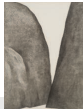
Georgia O'Keeffe, From a River Trip , 1962. Hứa tặng bởi Janie C. Lee.