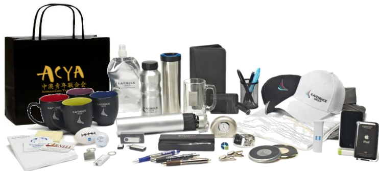
禮品袋或抽獎活動獎品的樣品