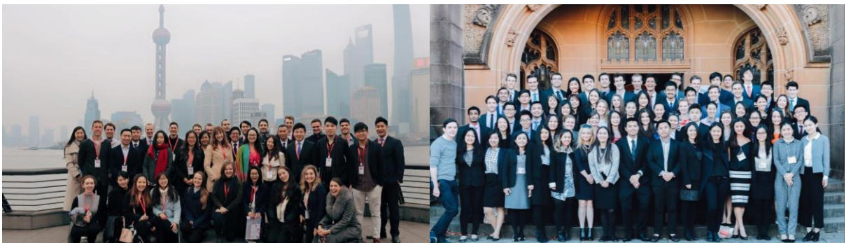
從上到下: ACYA 成員在雷州當志願者教師; 贊助商- The Giants- 贈予免費門票給 ACYA 成員欣賞 AFL 比賽; 在中國農曆新年時的 ACYA 成員; 綜合了在 ACYA 活動的公司和演講者; 2016 年 ACELS 在上海; 2015 年 ACELS 在悉尼。